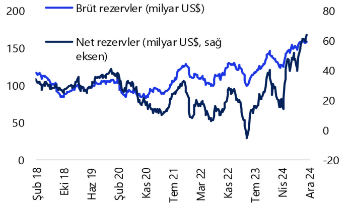
TCMB Brüt & Net Rezervler (milyar $)